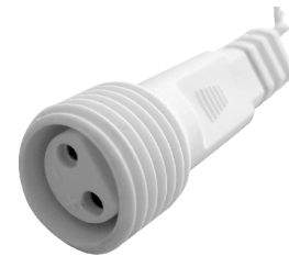
fig. 2. / 2. ábra / obraz 2. / Figura 2. / 2. skica / obraz 2.