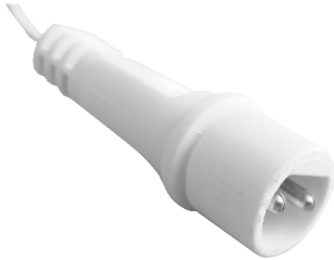
fig. 1. / 1. ábra / obraz 1. / Figura 1. / 1. skica / obraz 1.